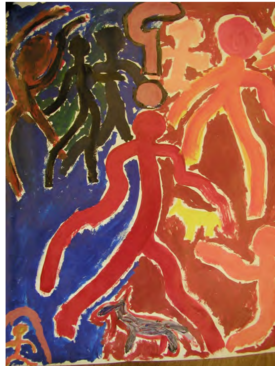
"Personene med de kalde fargene er min biologiske familie, - bortsett fra søsteren min nede i hjørnet som er varm. Hun tror på meg og støtter meg. Personene og dyrene med de varme fargene er fosterfamilien min og dyrene deres.

broren min siden jeg anmeldte han. Jeg klarer ikke å møte han. Han har ødelagt både ungdomstiden min og selvbildet mitt. Jeg har hatt spiseforstyrrelser og andre problemer. Det verste er at han går fri! Med ryggen rak kan han le av meg. Er det dette som kalles søskenkjærlighet? I dag klarer jeg hverdagen bra. Jeg har jobb og venner, men jeg vil aldri fortelle dem om overgrepene. Da vil vennene forsvinne og jeg blir alene. Slik er det. Det må ties for at jeg skal leve normalt. Jeg ønsker egentlig å fortelle og bli forstått. Jeg vil møte andre i min situasjon. Jeg vet jeg ikke er alene om dette. Dessverre.